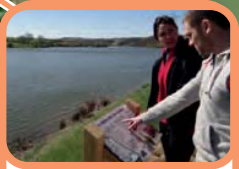
Sendero de interpretación