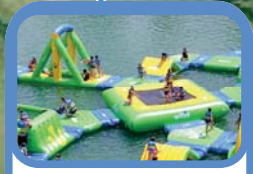
Jeux aquatiques Baignade